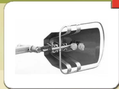
Barra sottochioma con cofano corto