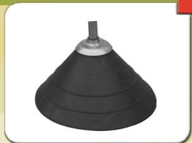
Barra sottochioma in gomma Ø 520