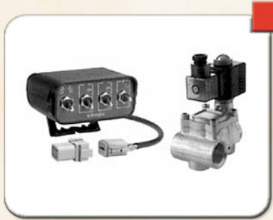
Kit valvole a solenoide n.02 + scat. Elet.