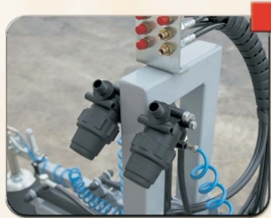
Filtri in mandata