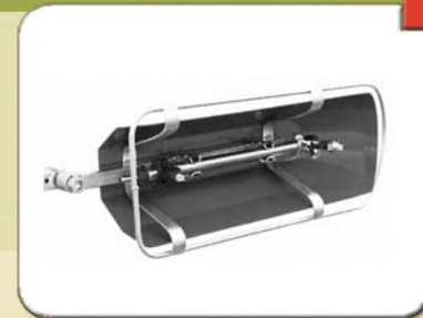
Barra sottochioma con cofano lungo