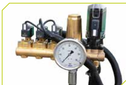
Kit valvole elettriche in ottone per apertura, chiusura e regolazione pressione acqua