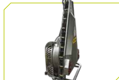
Supplemento gruppo aria torretta