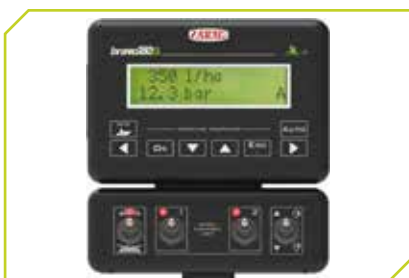
Computer per distribuzione automatica del prodotto